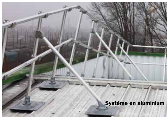
Système en aluminium